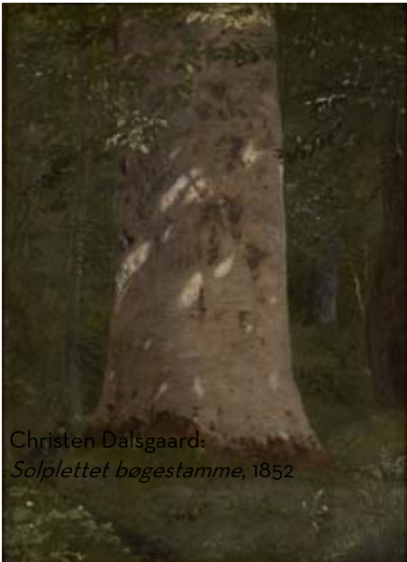
Christen Dalsgaard: Solplettet bøgestamme, 1852