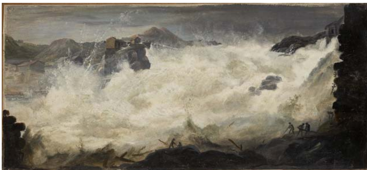
Erik Pauelsen: Sarpfossen , 1788