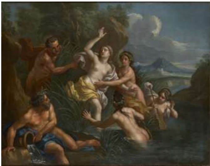
Hendrik Krock: Pan og Syrinx . 1722.