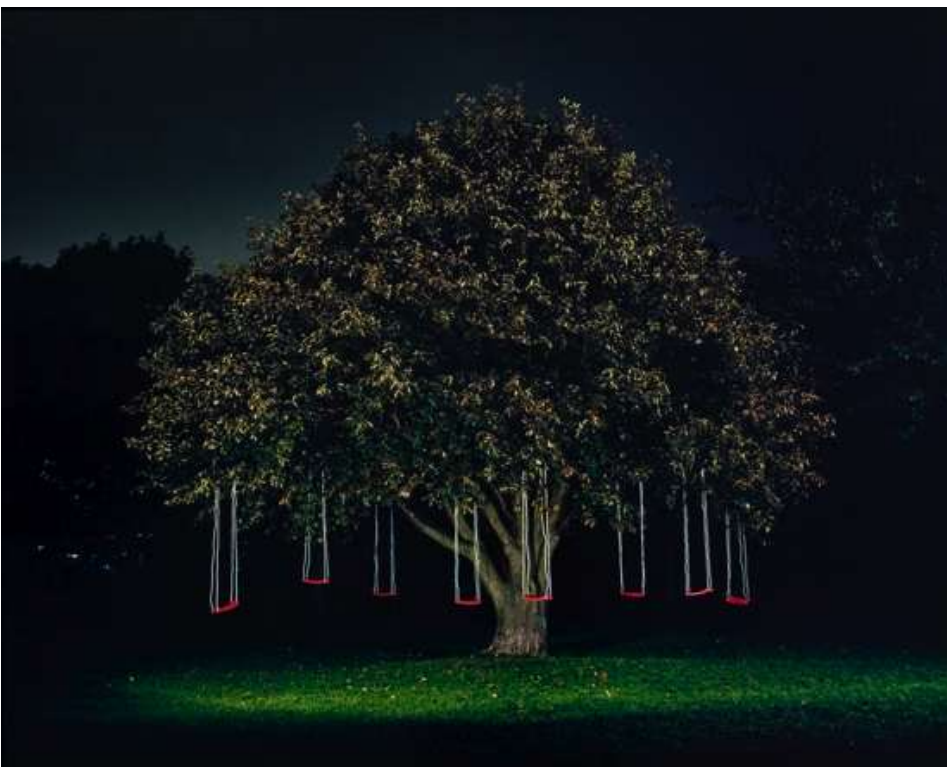
Astrid Kruse Jensen: Constructing a Memory , 2006