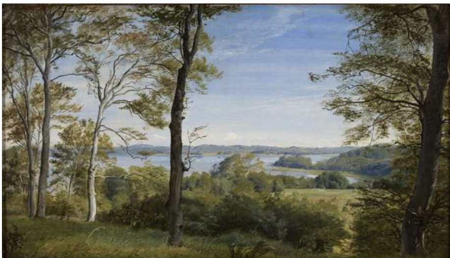
P.C. Skovgaard: Udsigt over Skarritsø , 1844

Nedenfor ses en række eksempler på kunstværker, som vi arbejder med på museet. Det er dog vigtigt at være opmærksom på, at ikke alle de viste værker nødvendigvis vil indgå i forløbet, da der løbende ændres i museets faste udstillinger.