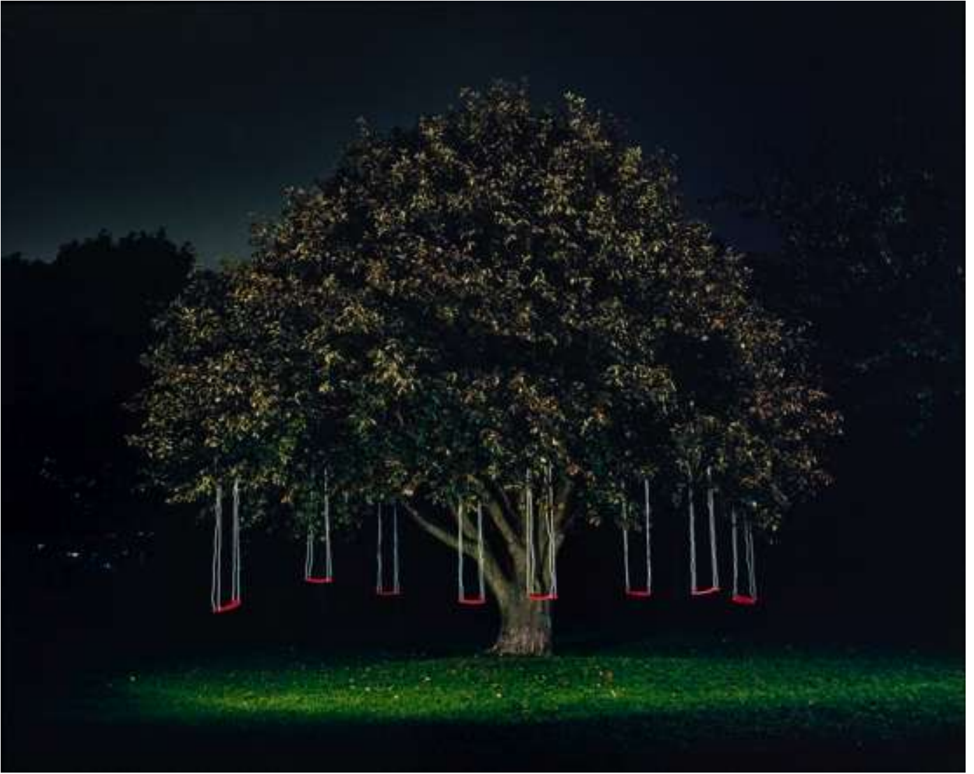
Astrid Kruse: Constructing a memory . 2006.