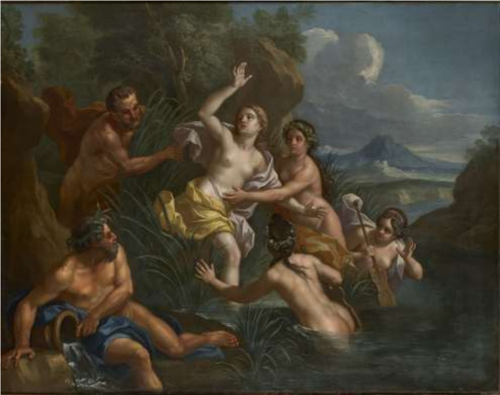
Hendrik Krock: Pan og Syrinx . 1722.