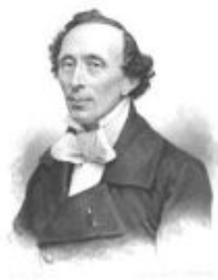
H. C. Andersen (1805-1875) skriver i 1842 En digters bazar , stærkt inspireret i både form og indhold af sin første togtur.