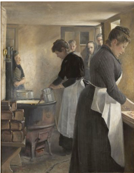
L.A. Ring: Maduddeling på Frederiksberg . 1887