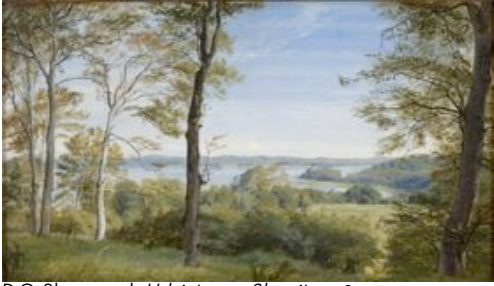
P.C. Skovgaard: Udsigt over Skarritsø , 1844.