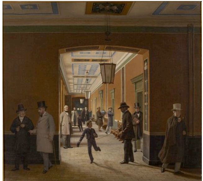
Christen Dalsgaard: Stengangen på Sorø Akademi . 1871.

Sammen med museets kunstformidler undersøger eleverne en række kunstværker, som afspejler den kunsthistoriske udvikling samt kunstens relation til historie, kultur og samfund på et givent tidspunkt. Vi går til dels kronologisk til værk men fokuserer også på korrespondancer og ligheder på tværs af tid, udtryk og medier. Vi zoomer ind på relevante værker og analyserer ud fra forskellige metoder deres tema. Nedenfor ses en række eksempler på kunstværker, som kan gennemgås på museet. Vær opmærksom på, at de viste værker ikke nødvendigvis vil indgå i forløbet, da der løbende foretages ændringer i udstillingen af museets faste samling.