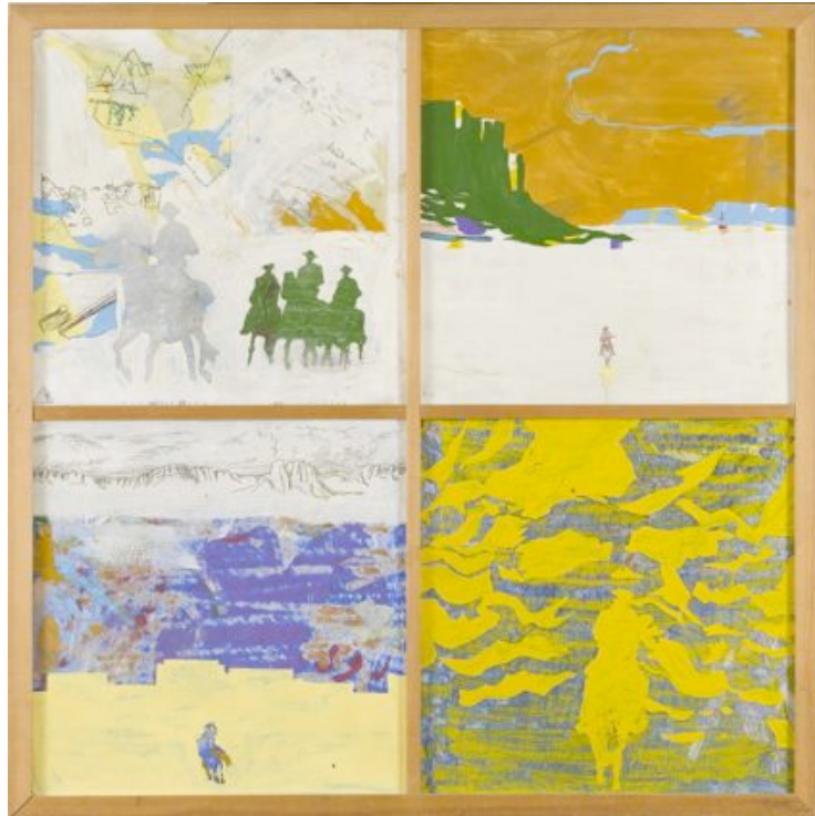
Per Kirkeby: Den langløbede Colt . 1966