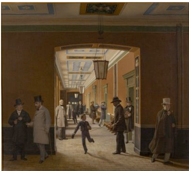
Christen Dalsgaard: Stengangen på Sorø Akademi med portrætfigurer , 1871.