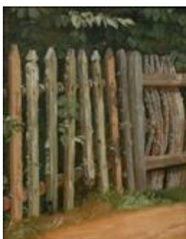
Christen Dalsgaard: Ved Havegærdet, 1850

I dag fremhæver flere kunstkritikere det interessante ved Christen Dalsgaards små men omhyggeligt udførte olieskitser og detaljestudier fra omkring 1850'erne. Man kan kun gisne om, hvorvidt han selv opfattede disse close-ups som et nødvendigt onde (og derfor med begejstring hilste fotografiet velkomment som et tidsbesparende hjælpemiddel) eller om han brugte skitserne på en mere eksperimenterende og selvudviklende måde. I dag tildeles de opmærksomhed, fordi de er et eksempel på en mere moderne, tilfældig og dristig beskæring af detaljer og fragmenter. I dag finder vi en tilfældig og skæv komposition i den såkaldte snapshotæstetik, der er almindelig hos mange nyere kunstfotografer.