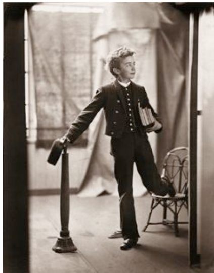
Elev fra Sorø Akademi