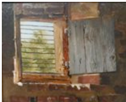
Christen Dalsgaard: Studie fra et udhus, 1850