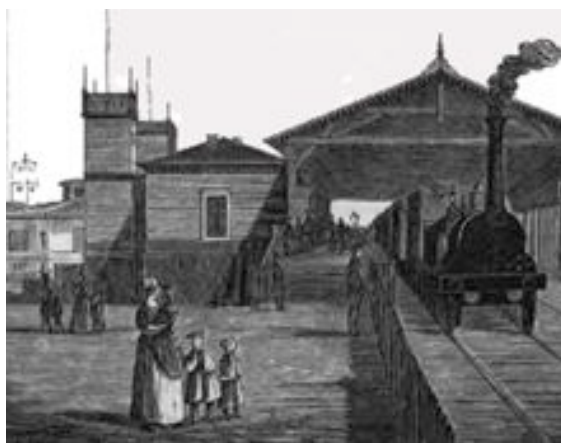
Københavns 1. jernbane, 1848