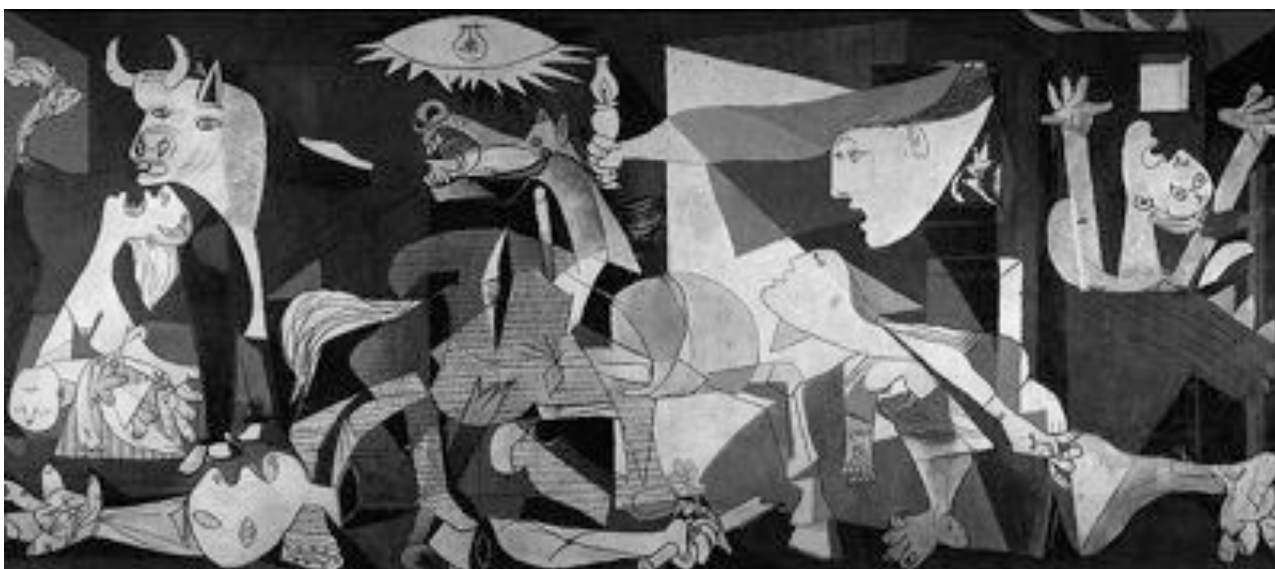
Pablo Picassos Guernica